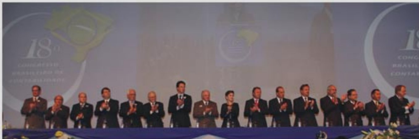
Mesa de honra da solenidade de abertura do 18º Congresso Brasileiro de Contabilidade