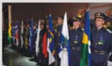
Cerimônia das bandeiras

Uma solenidade grandiosa, digna do porte do 18º CBC, abriu oficialmente ontem o evento a mais de cinco mil profissionais contábeis brasileiros e de delegações vindas de Angola, Portugal, Venezuela, Paraguai, Uruguai, Panamá, México, Argentina e República Dominicana. Na mesa de honra, alguns dos maiores nomes da Contabilidade nacional e internacional representaram as entidades de classe, as empresas, o mundo acadêmico e os poderes Executivo e Legislativo brasileiros.